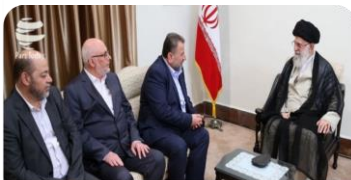
رهبر معظم انقلاب اسلامی در دیدار هیئتی عالی رتبه از جنبش مقاومت اسلامی (حماس).

موضوع فلسطین قطعاً به نفع مردم فلسطین و دنیای اسلام تمام خواهد شد