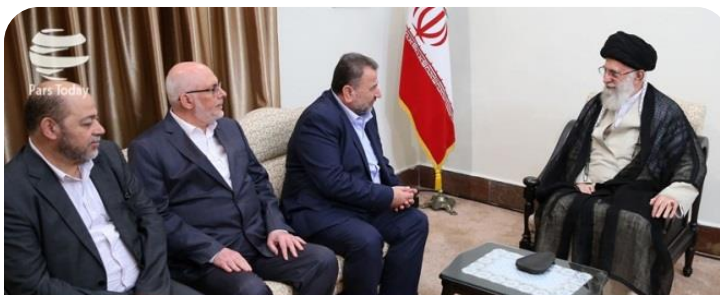
رهبر معظم انقلاب اسلامی در دیدار هفتی عالیه از جنبش مقاومت اسلامی (حماس):

* فتوکامنت: موضوع فلسطین قطعاً به نفع مردم فلسطین و دنیای اسلام تمام خواهد شد